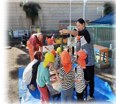
ワークでお正月の門松🎍作りを始めたよ！

さて、今年も残すところあと1か月となりました。今年もさまざまな形でご協力いただいたことに感謝申し上げます。保育士体験と一緒にたくさん遊んでくれたこと、目を細めながら嬉しそうに保育参観してくれたこと、保育のお手伝いで虫博士になって子どもたちと楽しい時間を過ごしてくれたこと、日よけのシェード張りを手伝ってくれたこと…子どもたちにとっても嬉しく楽しい時間だったと思います！そして職員にとっても、保護者の方々と同じ時間に同じ思いを共有できたことが何より嬉しく、楽しいひとときでした♪