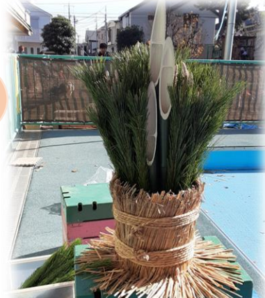
ワークショップで子どもたちが作った門松♪